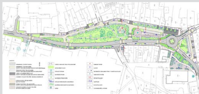
■ Architektonická situace prostoru náměstí