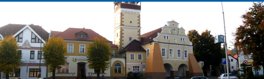
■ Budova radnice