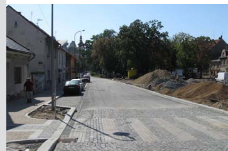
■ Ulice Cukrovarská - výstavba