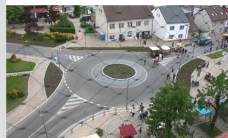
■ Pohled na okružní křižovatku z radniční věže