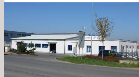
■ Huber Průhonice – provozní areál