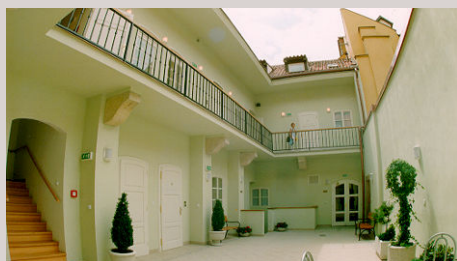
■ Penzion Anežka – rekonstrukce objektu