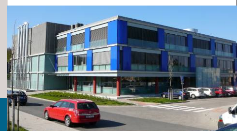
■ O2 – Praha – provozní centrum