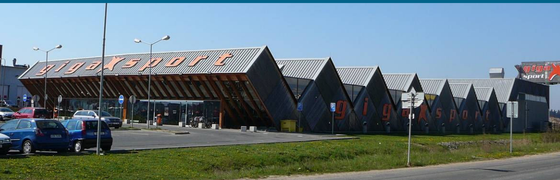
■ Gigasport Průhonice – obchodní centrum