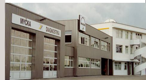
■ MAN – Průhonice – servisní a administrativní centrum