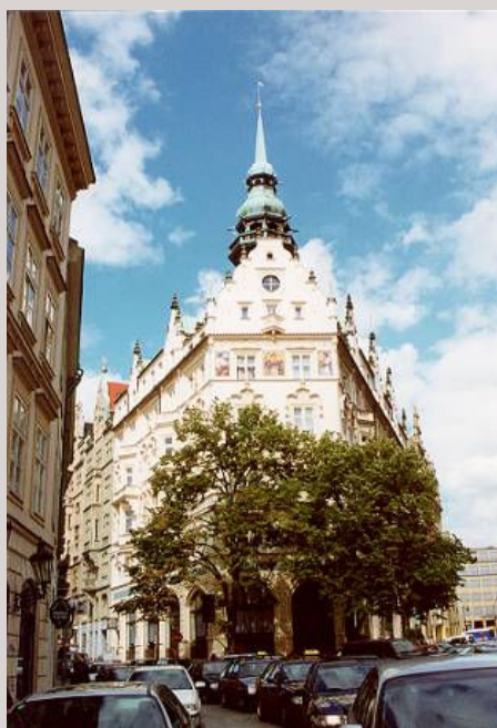
■ Hotel Paříž – Praha – rekonstrukce objektu