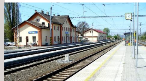
■ Modernizace trati Červenka – Zábřeh, žst. Mohelnice