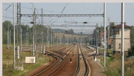
■ Modernizace žst. Horní Dvořiště

Při řešení úkolů spolupracuje se sesterskými odbornými odděleními IKP a stálým osvědčeným týmem subdodavatelů a expertů. Zkušený tým řeší projekty modernizací železničních koridorů, přeložky a rekonstrukce regionálních tratí, projekty vleček, přejezdů a zastávek, koncepční studie celostátních tratí i krajských a městských kolejových systémů. K zákazníkům patří Správa železniční dopravní cesty, Ministerstvo dopravy ČR, krajské a městské úřady i soukromé podnikatelské subjekty.