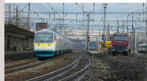
■ Modernizace trati Praha Libeň – Praha Běchovice, rekonstrukce žst. Praha Běchovice