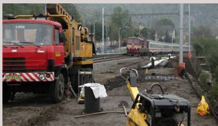
■ Optimalizace trati Ústí nad Labem – Děčín, rekonstrukce zastávky Mojžíř

Při řešení úkolů spolupracuje se sesterskými odbornými odděleními IKP a stálým osvědčeným týmem subdodavatelů a expertů. Zkušený tým řeší projekty modernizací železničních koridorů, přeložky a rekonstrukce regionálních tratí, projekty vleček, přejezdů a zastávek, koncepční studie celostátních tratí i krajských a městských kolejových systémů. K zákazníkům patří Správa železniční dopravní cesty, Ministerstvo dopravy ČR, krajské a městské úřady i soukromé podnikatelské subjekty.